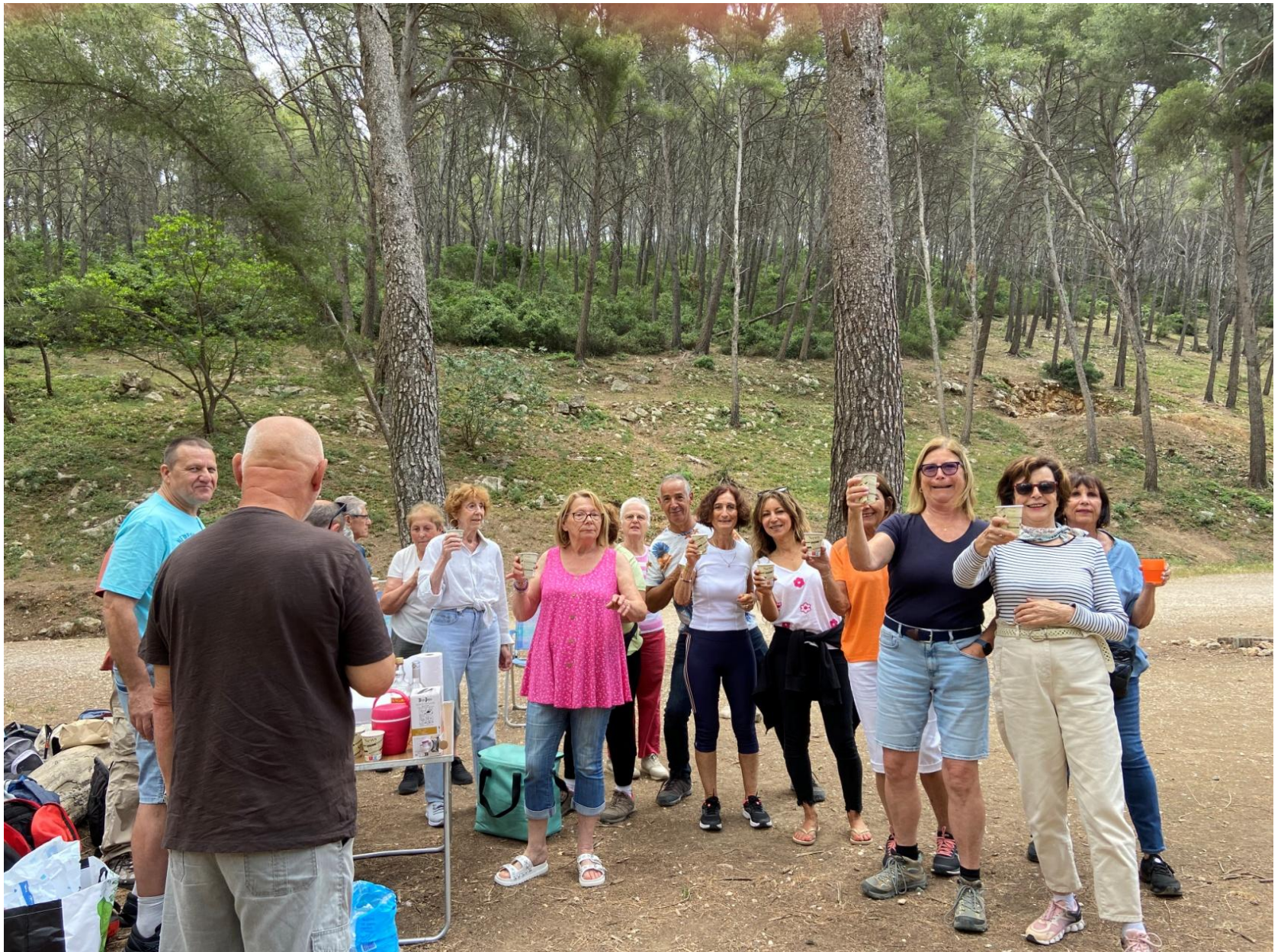
Pique nique clôture du 1er semestre 2024