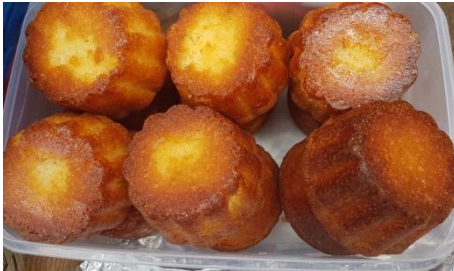
Pique nique clôture du 1er semestre 2024