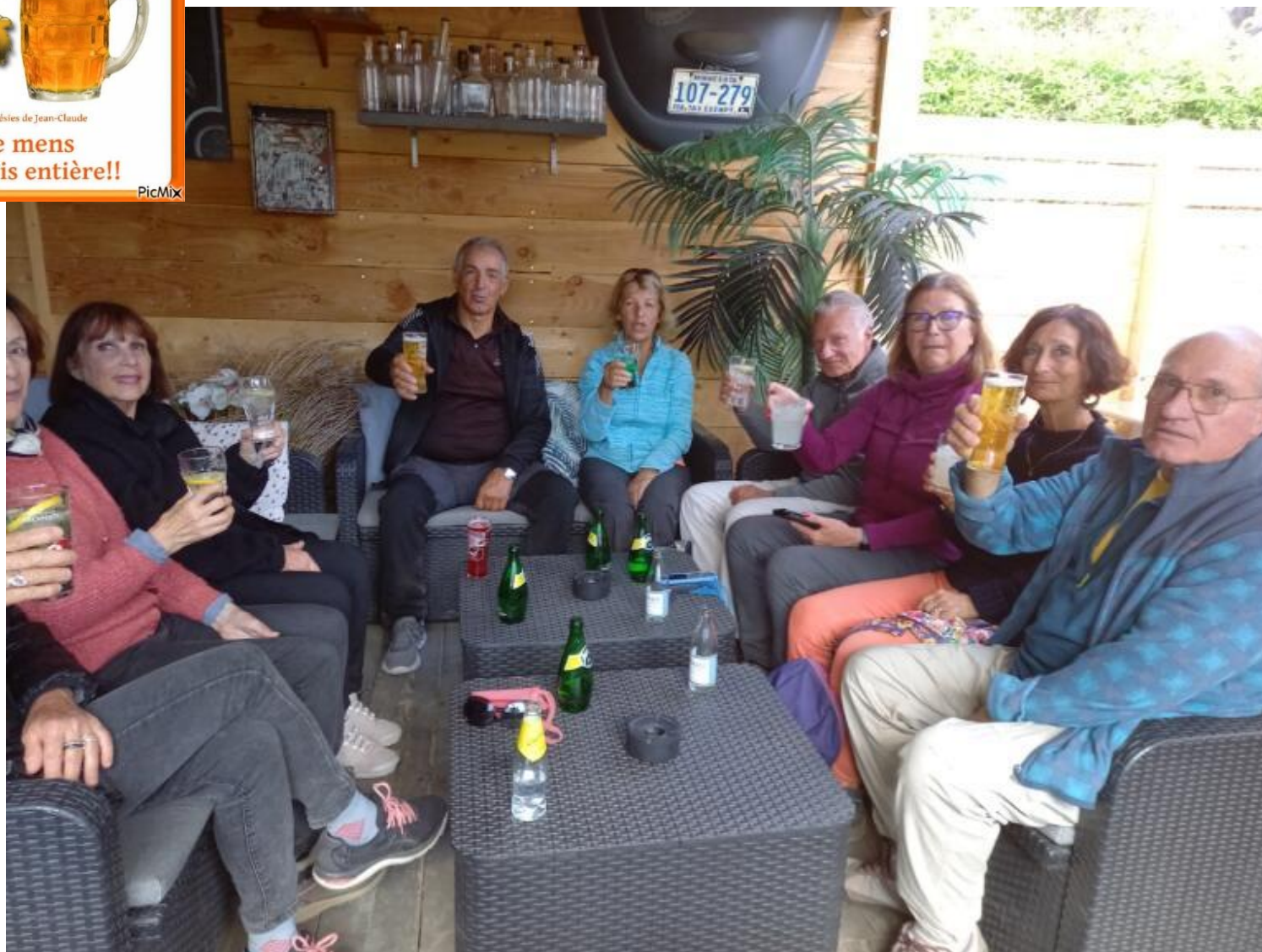
Les Falaises de la Bouilladisse